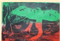
ご近所文化祭 沢山の作品を展示しました