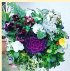
お花作り ハギソングバセット