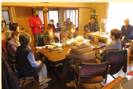
みなさん集まった木曜サロン