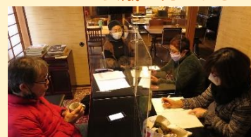
メニュー会議 何にする？